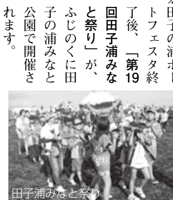
田子浦みなど祭り