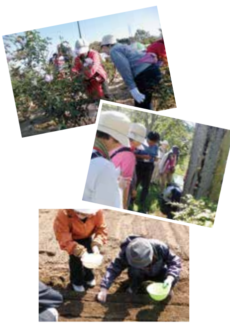
▲セカンドライフの活動

市は、社会貢献活動に関心のある中高年世代を対象にした相談窓口「セカンドライフ相談室」を開設し、市内の市民活動団体をはじめ、皆さんの興味に沿った情報を案内しています。セカンドライフ相談室で、新しい生きがいを見つけ、充実したセカンドライフを送りませんか？