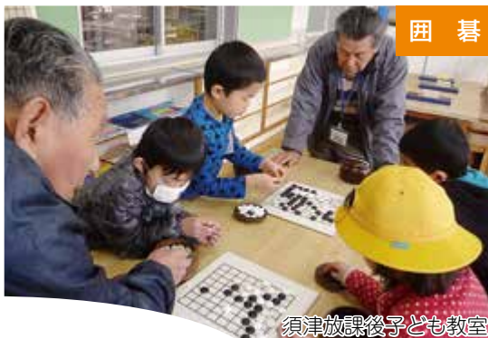
須津放課後子ども教室