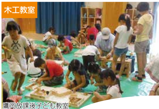
鷹岡放課後子ども教室