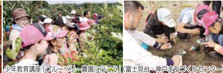
少年教育講座「ブルーベリー農園に行こう」(富士見台・神戸まちづくりセンター)