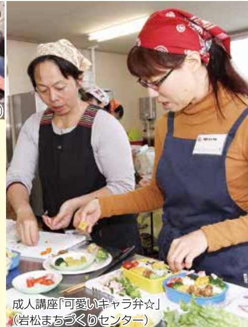
成人講座「可愛いキャラ弁☆」 (岩松まちづくりセンター)