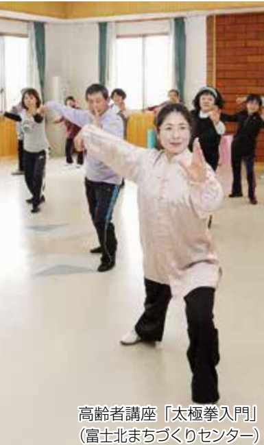
高齢者講座「太極拳入門」 (富士北まちづくりセンター)