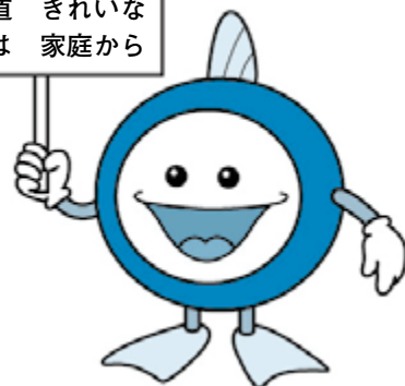
下水道マスコットキャラクター スイスイくん