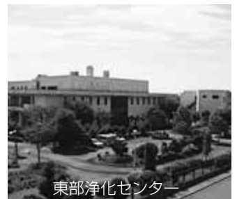
東部浄化センター

◆中野台下水処理施設の使用料も引き上げます 中野台下水処理施設の使用料も、下水道使用料と同じ料金体系のため、同様に引き上げます。