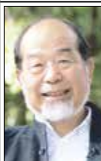
鎌田 實 (医師、作家)