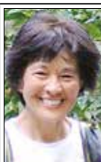
三好礼子 (アウトドア派エッセイスト、国際ライター)