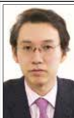
門倉貴史 (エコノミスト、BRICs経済研究所代表)