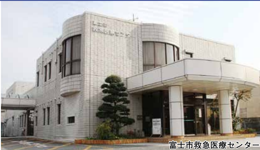
富士市救急医療センター

皆さんも、これを機に救急医療や災害医療など、身近な医療について考えてみませんか。