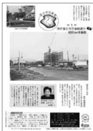
第1回 平成15年4月5日号

昭和41年11月、富士市の誕生とともに創刊した「広報ふじ」。40年以上の長い歴史の中で、5日号の裏表紙は「ふるさとの昔話」が最も長く連載されてきました。その後、「道具」「富士山・風景」「民話」「民俗芸能」などを題材に、市民の皆さんに登場していただき、その思いを語っていただくコーナーに変わりました。