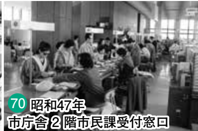
70 昭和47年 市庁舎2階市民課受付窓口