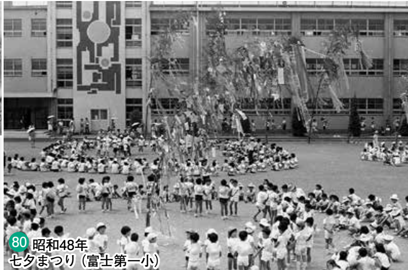
80 昭和48年 七夕まつり (富士第一小)