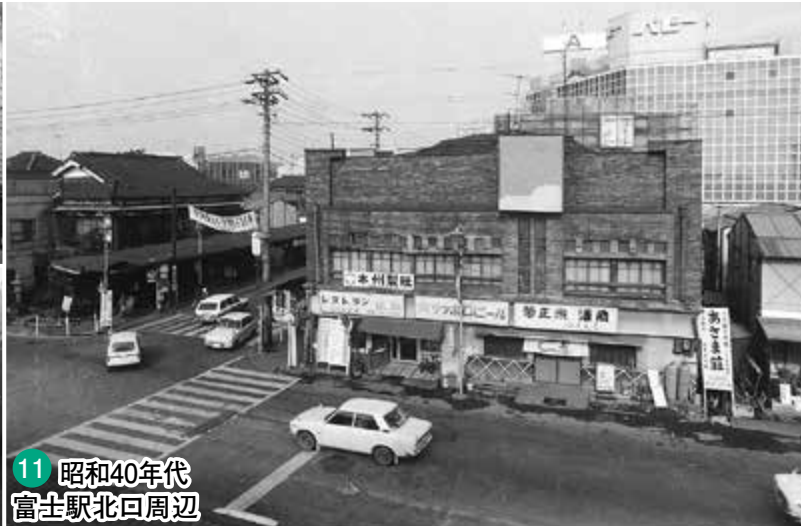
11 昭和40年代 富士駅北口周辺