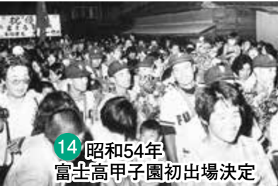
14 昭和54年 富士高甲子園初出場決定