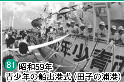
81 昭和59年 青少年の船出港式(田子の浦港)