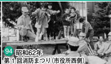
94 昭和62年 第1回消防まつり (市役所西側)