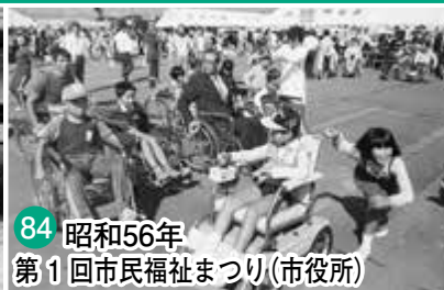
84 昭和56年 第1回市民福祉まつり(市役所)