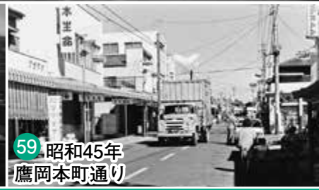
59 昭和45年 鷹岡本町通り