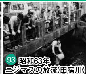
93 昭和63年 ニジマスの放流 (田宿川)