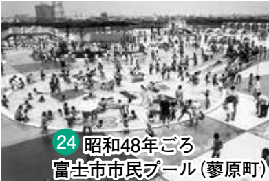
24 昭和48年ごろ 富士市市民プール(蓼原町)