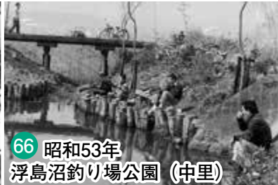
66 昭和53年 浮島沼釣り場公園 (中里)