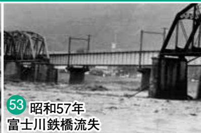
53 昭和57年 富士川鉄橋流失