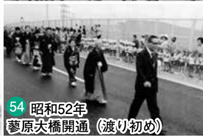
54 昭和52年 蓼原大橋開通 (渡り初め)