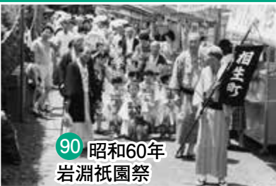
90 昭和60年 岩淵祇園祭