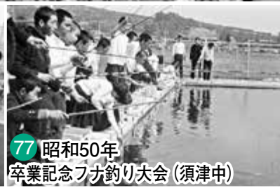
77 昭和50年 卒業記念フナ釣り大会 (須津中)