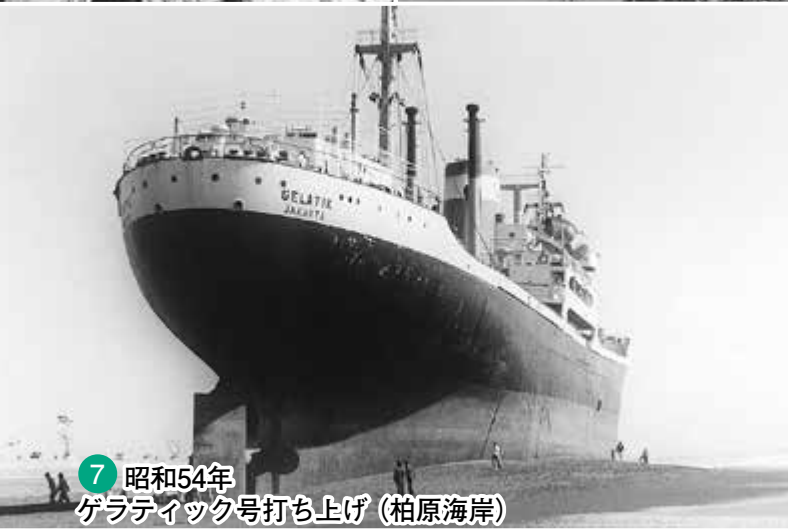
7 昭和54年 ゲラティック号打ち上げ (柏原海岸)