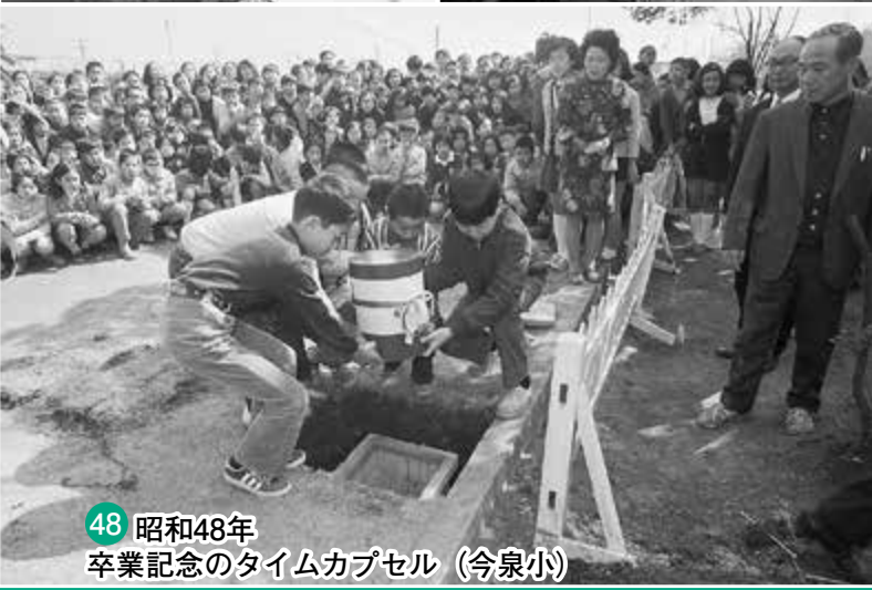
48 昭和48年 卒業記念のタイムカプセル (今泉小)