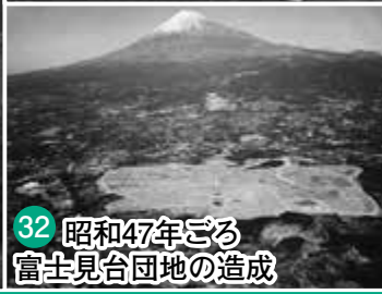
32 昭和47年ごろ 富士見台団地の造成