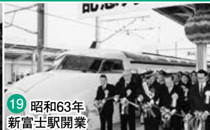
19 昭和63年 新富士駅開業