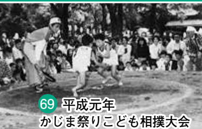
69 平成元年 かじま祭りこども相撲大会