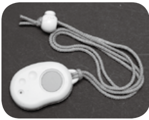
▲ペンダント式通報装置