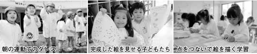
朝の運動でのダンス