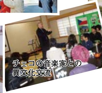
チェコの音楽家との 異文化交流