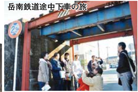
岳南鉄道途中下車の旅