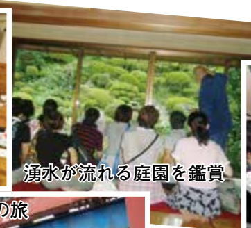
湧水が流れる庭園を鑑賞