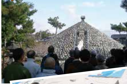
鈴川の富士塚から村山道へ出発