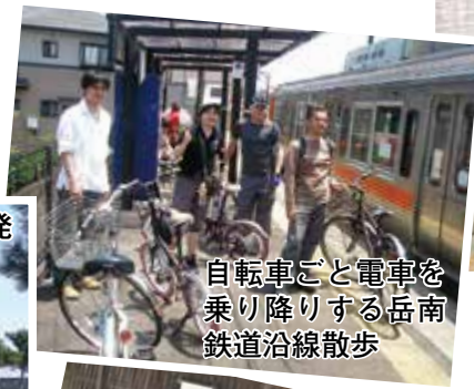
自転車ごと電車を 乗り降りする岳南 鉄道沿線散歩