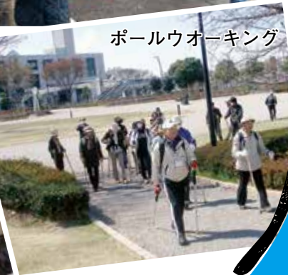
ポールウォーキング