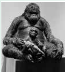
▲一ツ山チ工作「紙の芸術」