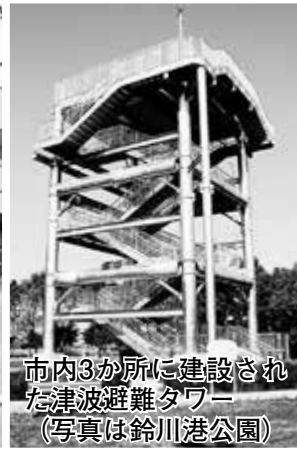
市内3か所に建設された津波避難タワー (写真は鈴川港公園)