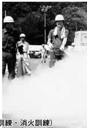
昨年富士川第一中学校で行われた富士川地区会場型防災訓練（左から救助訓練・応急救護訓練・消火訓練）