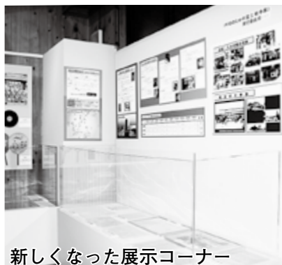
新しくなった展示コーナー