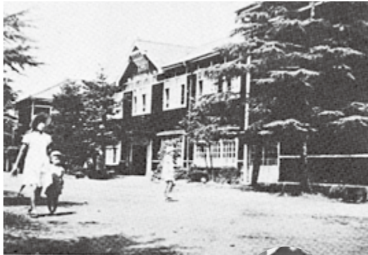
▲当時の今泉小学校