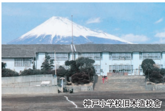
神戸小学校旧木造校舎