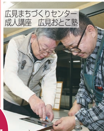
広見まちづくりセンター 成人講座 広見おとこ塾