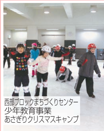
西部ブロックまちづくりセンター 少年教育事業 あさぎりクリスマスキャン