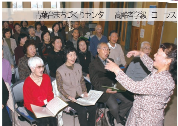
青葉台まちづくりセンター 高齢者学級 コーラス