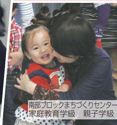
南部ブロックまちづくりセンター 家庭教育学級 親子学級