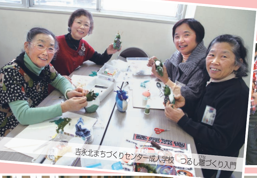
吉永北まちづくりセンター成人学校 つるし雛づくり入門