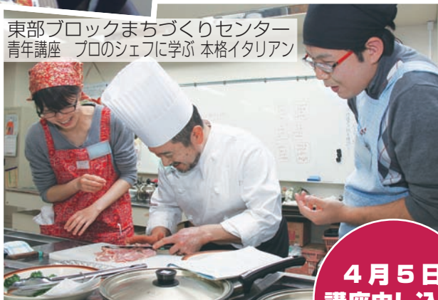
東部ブロックまちづくりセンター 青年講座 プロのシェフに学ぶ 本格イタリアン