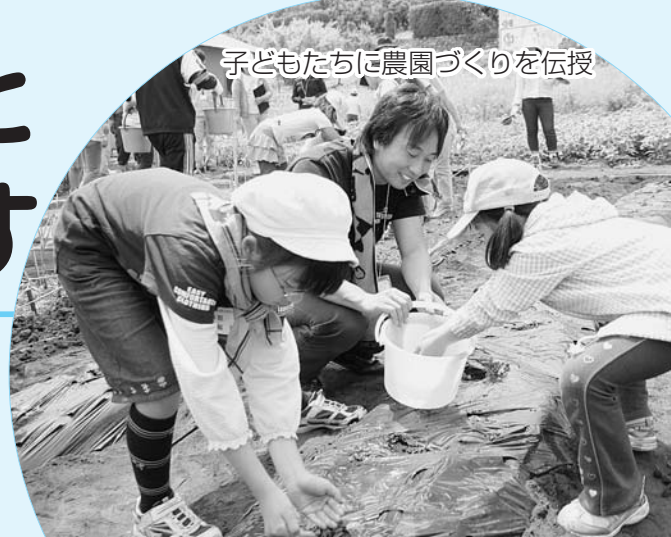
子どもたちに農園づくりを伝授

4月から、 エヌピーオー NPO法人の設立認証などの事務が 県から市に移ります。