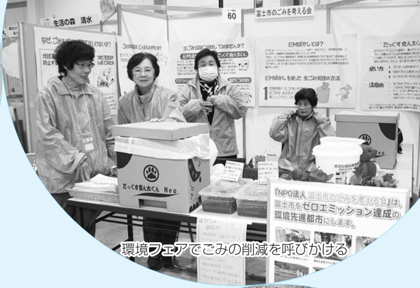
環境フェアでごみの削減を呼びかける