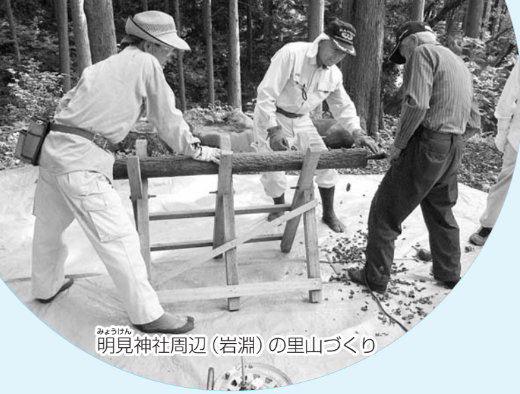
みょうげん 明見神社周辺(岩淵)の里山づくり