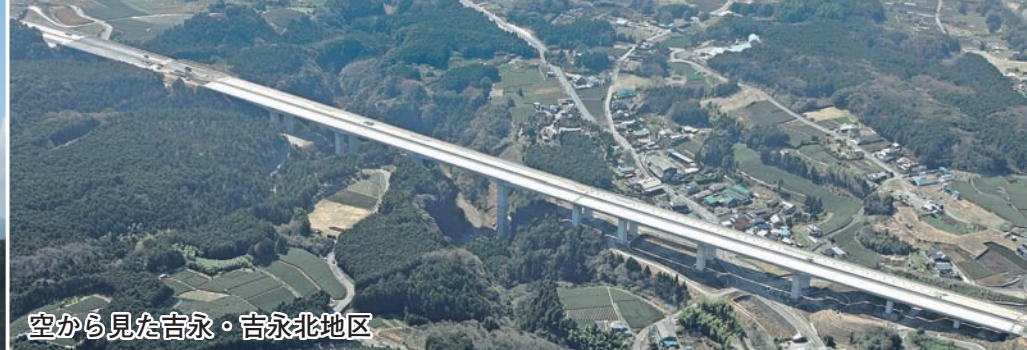
空から見た吉永・吉永北地区