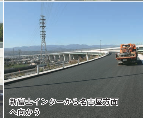
新富士インターから名古屋方面 へ向かう