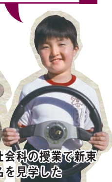
社会科の授業で新東名を見学した