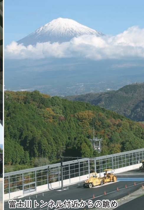
富士川トンネル付近からの眺め