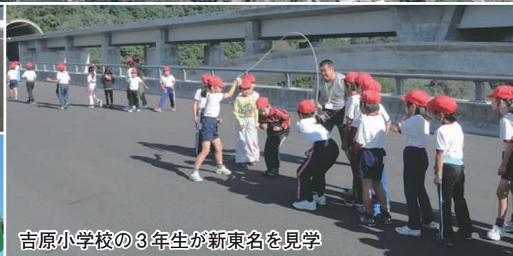
吉原小学校の3年生が新東名を見学