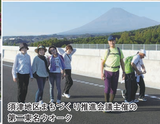
須津地区まちづくり推進会議主催の 第二東名ウォーク