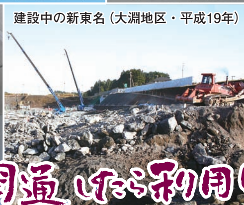
建設中の新東名(大淵地区・平成19年)