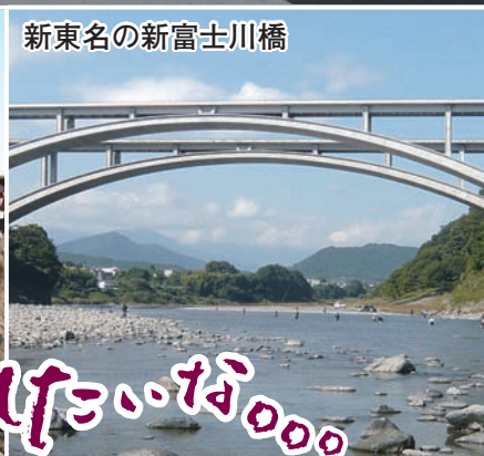
新東名の新富士川橋