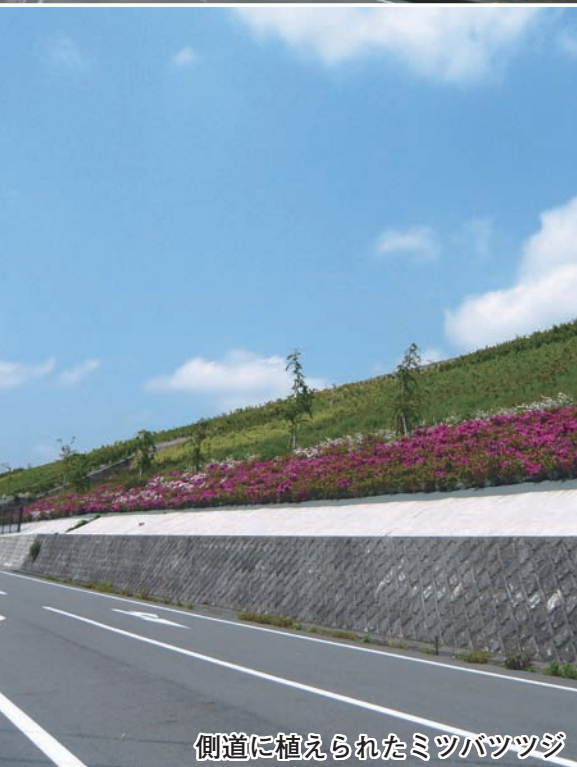
側道に植えられたミツバツツジ