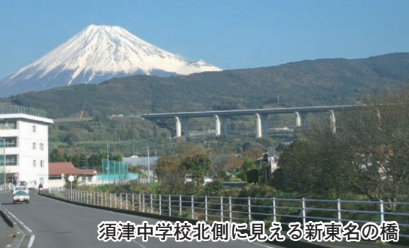
須津中学校北側に見える新東名の橋