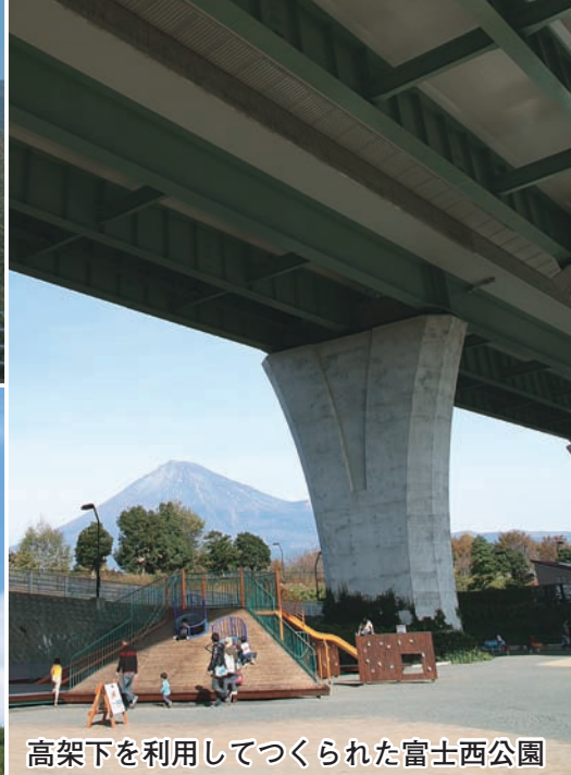
高架下を利用してつくられた富士西公園