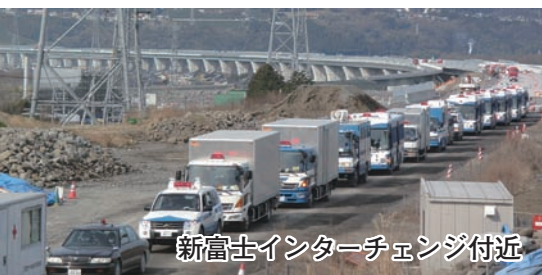
新富士インターチェンジ付近

昨年3月の東日本大震災のとき、約500台の緊急応援車両が藤枝岡部インターチェンジ〜新富士インターチェンジ間で走行しました。