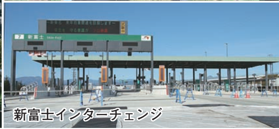
新富士インターチェンジ