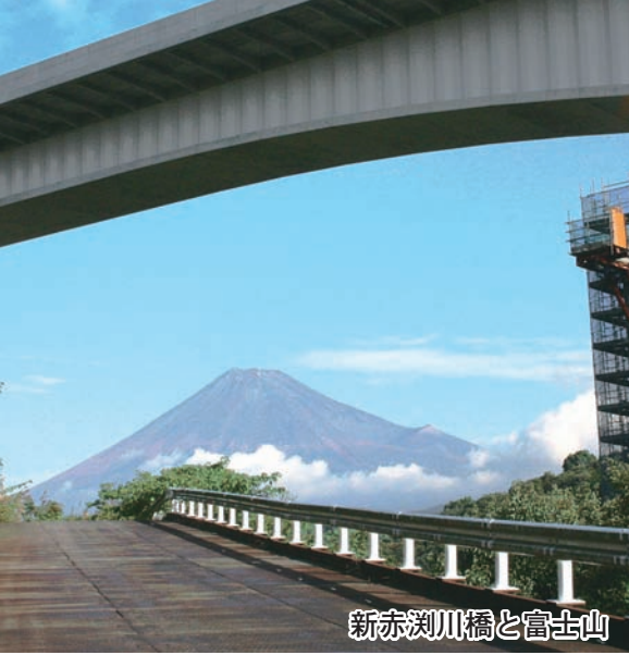
新赤沢川橋と富士山