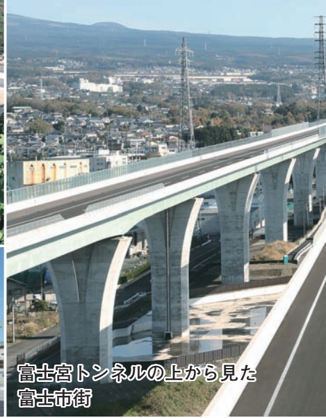
富士宮トンネルの上から見た富士市街