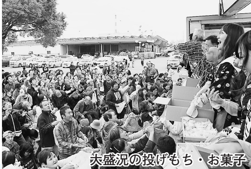
夫盛況の投げもち・お菓子