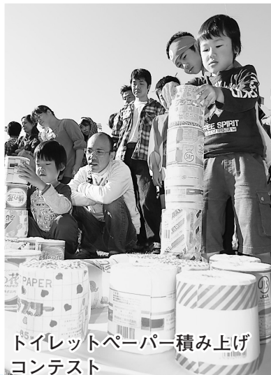
トイレットペーパー積み上げコンテスト

※商工フェアの内容は、一部変更する場合があります。詳しくは、前日11月4日(金)の新聞折り込みチラシをごらんください。