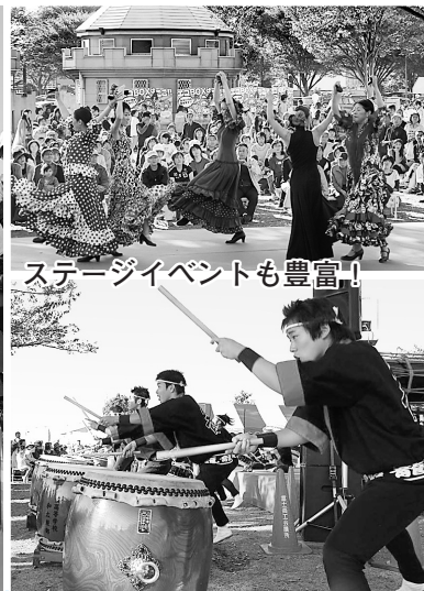
ステージイベントも豊富!