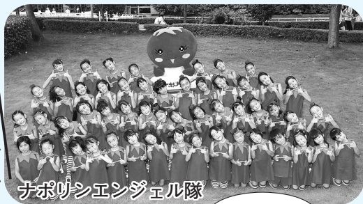
ナポリシエシジエル隊