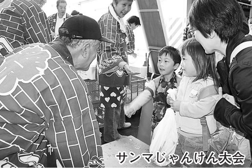
サンマじゃんけん大会