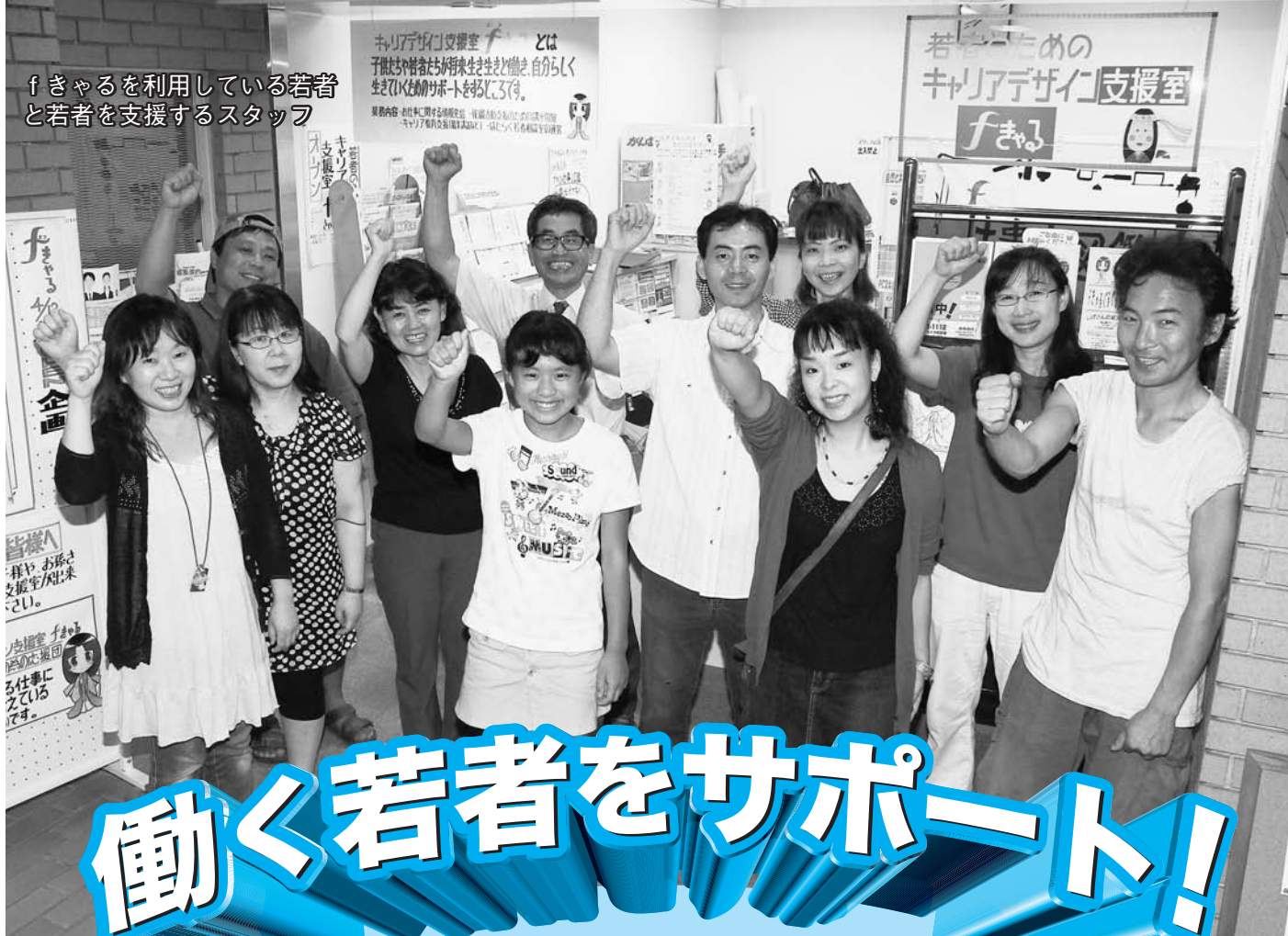
f きやるを利用している若者と若者を支援するスタッフ