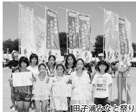
田子浦みなと祭り

完成したのぼり旗は、7月17日に実施した「田子浦みなと祭り」で披露され、食育標語とシラスキャラクターの入選者の表彰が行われました。