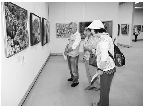
4日間で1,372人が訪れました

東日本大震災からの復興を願い、日本を元気づけようと、りぶす富士（公園事業課）によって植え替えられました。黄色のメランポジウムの花が敷き詰められた文字盤には、日の丸も形づくられました。来園者は足をとめ、花でつくられた温かな応援の言葉をしみじみと眺めていました。