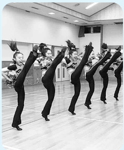
▲チーム全員の心が一つとなった演技

※チアダンスは、ヒップホップ・ラインダンス、ジャズ・ポンポンを使ったダンス、すべての要素を含む演技です。