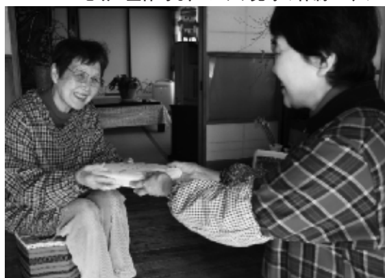
災害時要援護者の支援