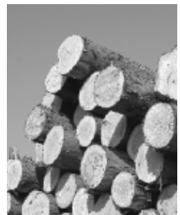
富士地域材の富士ヒノキ