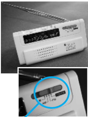
このスイッチで切りかえてください

※今回の地震で防災ラジオは完売しましたが、再販売する場合は広報紙などでお知らせします。