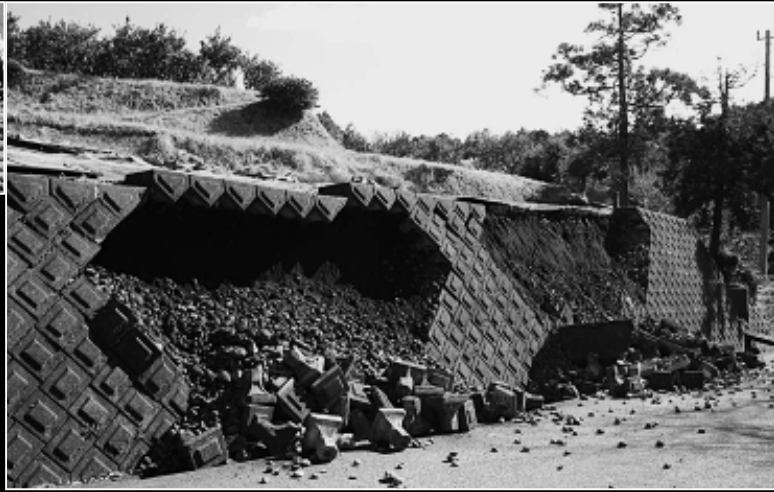
3月15日に発生した地震による市内の被害状況