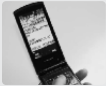
携帯電話に同報無線情報が配信