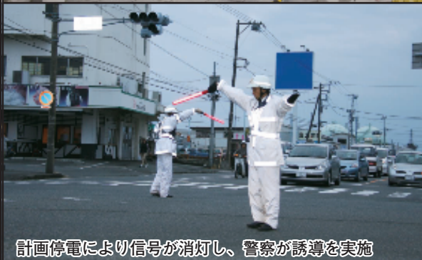
計画停電により信号が消灯し、警察が誘導を実施