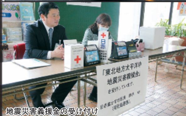
地震災害義援金の受け付け