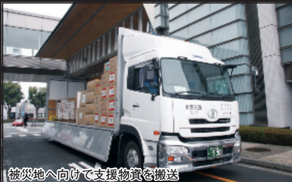
被災地へ向けて支援物資を搬送