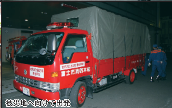
被災地へ向けて出発