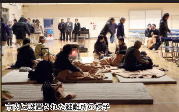
市内に設置された避難所の様子