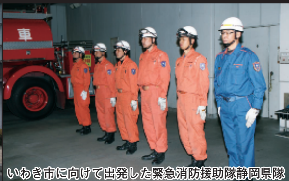
いわき市に向けて出発した緊急消防援助隊静岡県隊