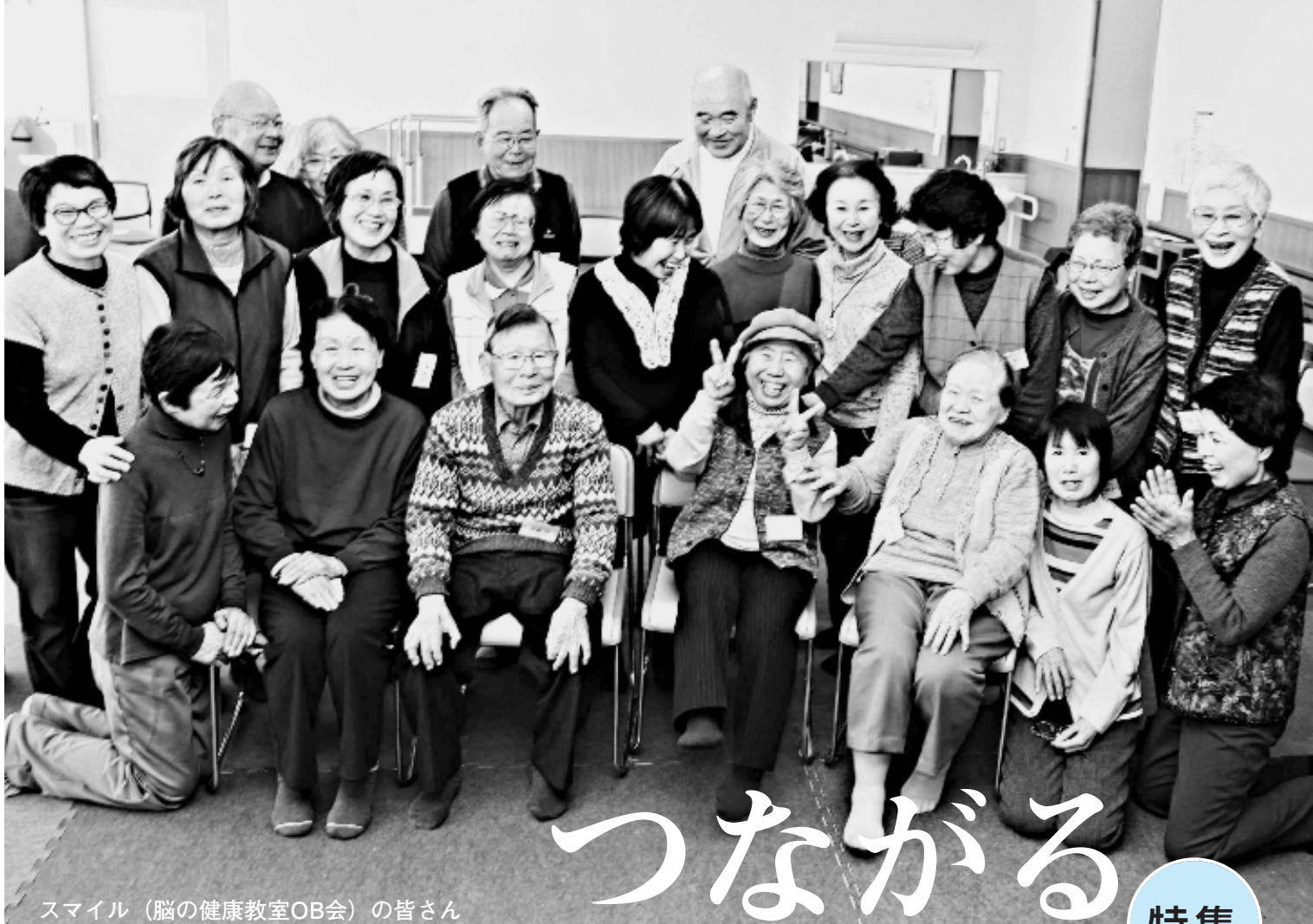
スマイル（脳の健康教室OB会）の皆さん