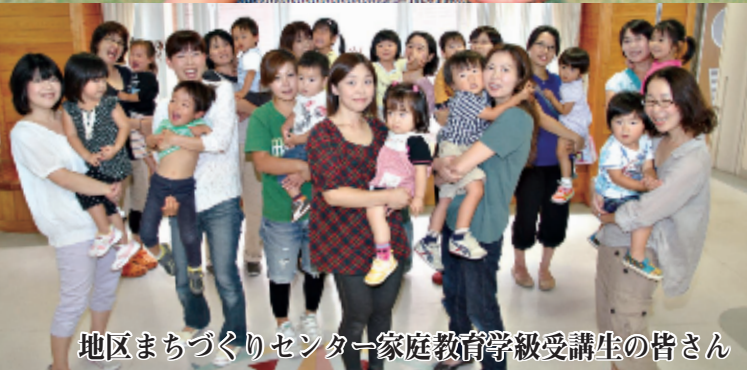
地区まちづくりセンター家庭教育学級受講生の皆さん