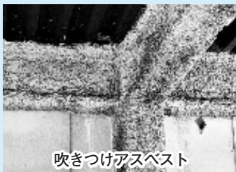
吹きつけアスベスト