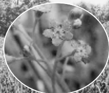
ナヨナヨワスレナグサ (4月)