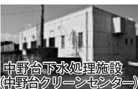
中野台下水処理施設 (中野台クリーンセンター)

旧富士川町地域の富士松野団地と中野台団地からの生活雑排水は、平成16年9月に設置された「中野台下水処理施設」（中野台クリーンセンター）で処理しています。