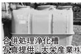
合併処理浄化槽