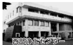
西部浄化センター

下水道区域は、東部処理区（3641ヘクタール）、西部処理区（2914ヘクタール）に区分され、それぞれ東部浄化センター、西部浄化センターで処理されています。