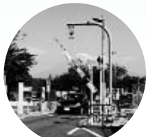
⑦スマートIC下り出口