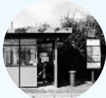
②東名松岡(上り線・下り線)