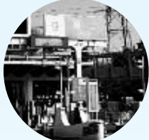
③東名富士(上り・下り)