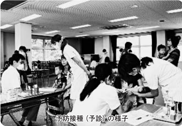
予防接種（予診）の様子

市は、10月から、県内で初めて季節性の「こどもインフルエンザ予防接種」に対する助成を行います。この助成は、こどものインフルエンザの発症や重症化、蔓延を防ぐとともに、保護者の予防接種にかかる経済的負担を軽減することを目的としています。また、「高齢者インフルエンザ予防接種」についてもあわせて紹介します。