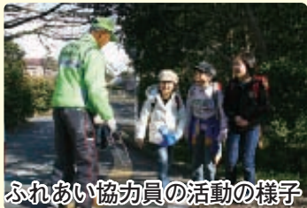
ふれあい協力員の活動の様子

からも、各学校の要望や現状を把握しながら活動に支障がないように対応していきます。