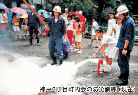
神戸2丁目町内会の防災訓練(現在)