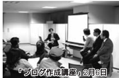
「ブログ作成講座」2月6日

完全個室の特別会議室（定員12人）も加わりました。非公開の経営会議やレッスンなどにお使いください。