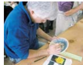
「チャレンジ!!陶芸」から

「富士山の法印さん ~大宝院秋山家 資料展~」 ~3月8日 休館日 2、9、12、16、23日