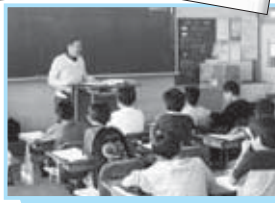
環境アドバイザーを小学校などに派遣