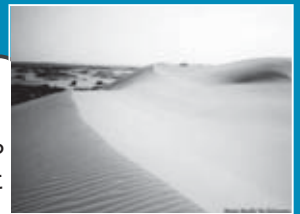
拡大を続けるホルチン砂漠 (中国北部内モンゴル自治区)