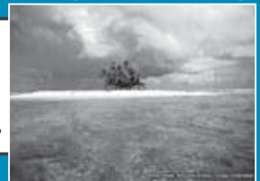
(南太平洋ツバル島)