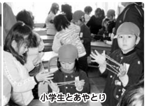
小学生とあやとり