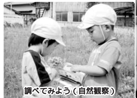
調べてみよう(自然観察)

人とのかわりを大切に 幼稚園での教育は、木に例えると根この部分であり、学習の基礎となる部分です。 幼稚園は、さまざまな遊びや体験を通じた教育をしています。子どもたちが集団生活の中で、自分の意見を言ったり、人の意見を聞いたりできる環境づくりをしています。 また幼稚園は、保護者や小・中・高等学校、高齢者、地域の人たちとのかわりを大切にしています。地域の人たちなどの協力を得ながら、さまざまな世代の人たちとふれあい、交流をしています。将来社会に出たときに、人とうまくかわっていきけるような子どもに育ってほしいですね。