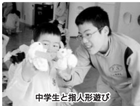
中学生と指人形遊び