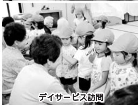
デイサービス訪問