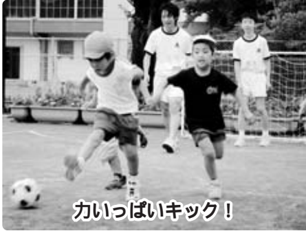
力いっぱいキック!