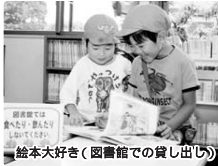
絵本大好き(図書館での貸し出し)