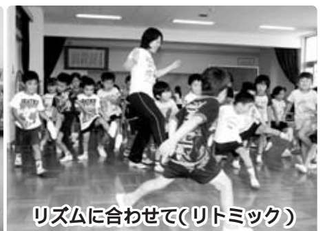
リズムに合わせて(リトミック)