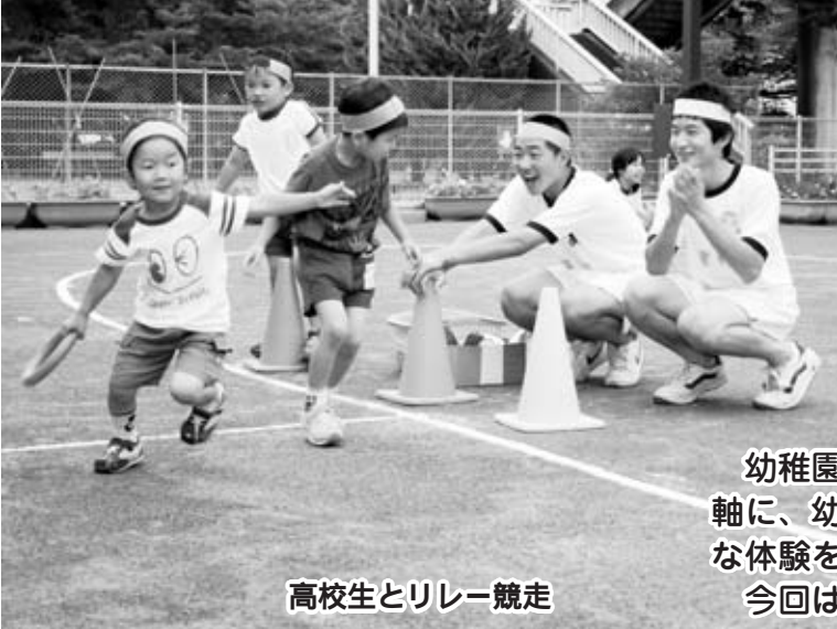
高校生とリレー競走