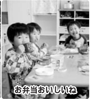
お弁当おいしいね