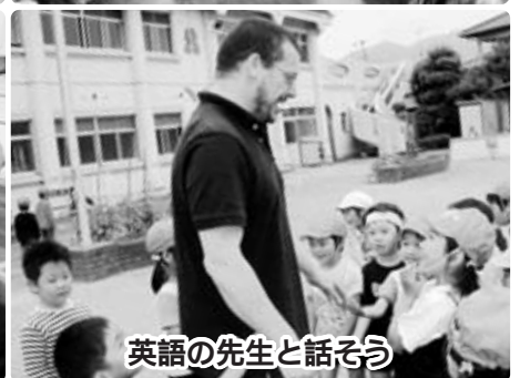
英語の先生と話そう