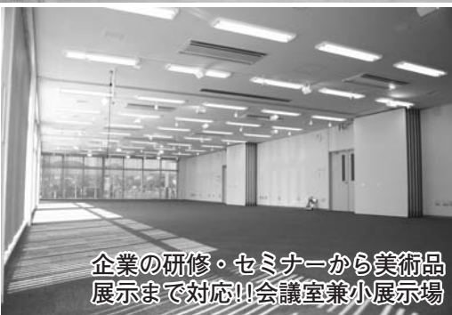
企業の研修・セミナーから美術品 展示まで対応!!会議室兼小展示場