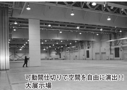
可動間仕切りで空間を自由に演出!! 大展示場