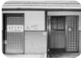
中央公園の野外ステージ東側トイレ