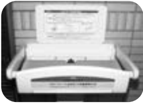
5月26日に新しく設置したベビシート