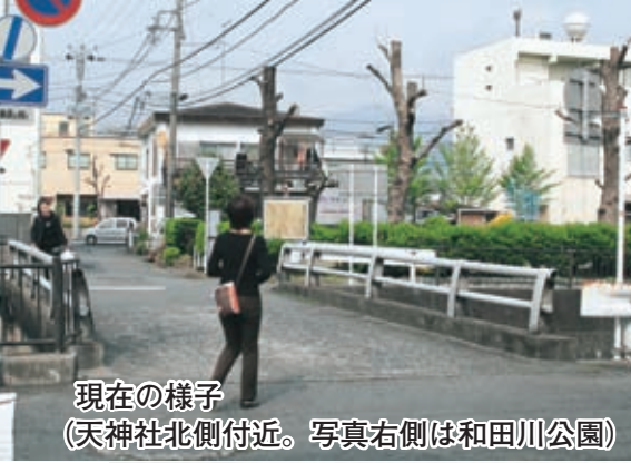
現在の様子 (天神社北側付近。写真右側は和田川公園)