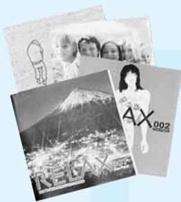
富士健康印商店会発行の「4X」や「RELAX」も必見！