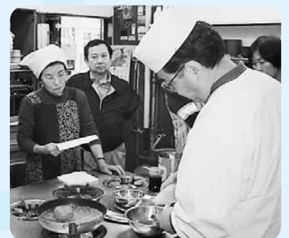
「家庭でできる簡単中華料理講座」

き店舗を活用し、新しく健ブリッジ大学の拠点が開館し、3月18日の10時からオープン。『宮下記念館』と名づけられ、3月18日の10時からオープニングセレモニーや健康に関する特別講座、お楽しみ大抽せん会などが開催されます。