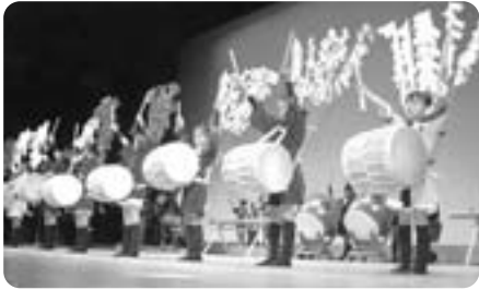
神戸雨乞い 芸能保存会

多年にわたり、地域に伝わる郷土芸能「雨乞い曼陀羅」の伝承に貢献されています。地域の行事などへの出演をはじめ、「NEW!!! わかふじ国体」や「ふるさと芸能祭」などにも積極的に出演し、先人が築き上げてきた貴重な伝統芸能を継承するための努力を重ねており、今後も活躍が大いに期待されます。