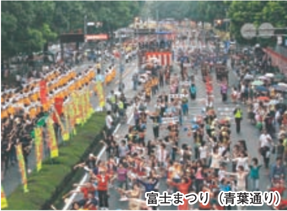
富士まつり (青葉通り)