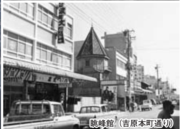
眺峰館 (吉原本町通り)