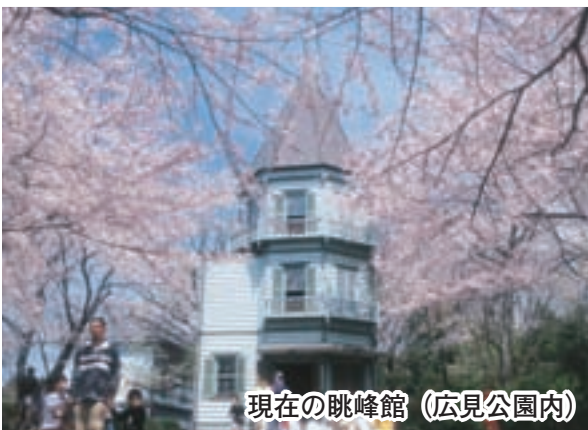
現在の眺峰館 (広見公園内)