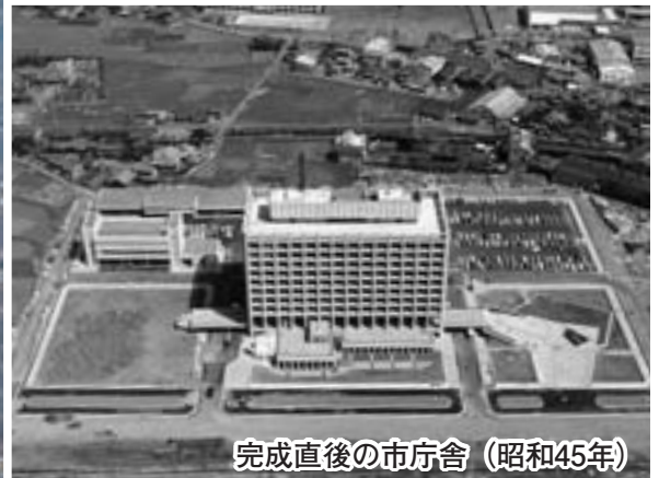
完成直後の市庁舎 (昭和45年)