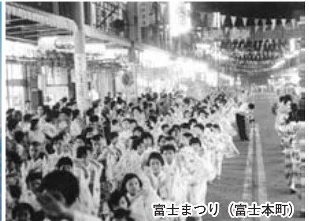
富士まつり (富士本町)