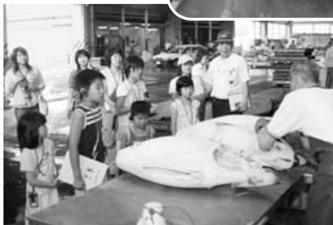
▲冷凍マグロの解体作業