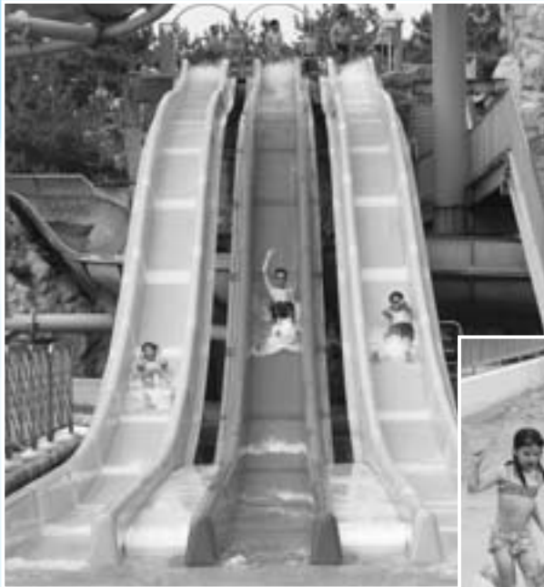
富士マリンプール ストレートスライダー (上) さざ波プール (右)