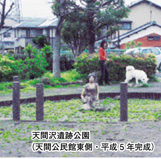
天間沢遺跡公園 (天間公民館東側・平成5年完成)