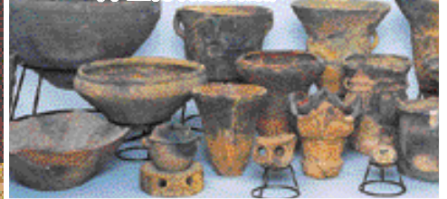
遺跡から出土した土器 (市立博物館所蔵)

天間沢遺跡は、縄文時代中ごろ(約4,500年前)を中心とした遺跡で、昭和初期には知られていました。多量の土器や石器のほか、竪穴住居跡や配石遺構(石を用いた墓など)が発見されています。