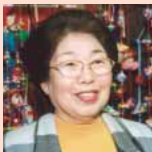
当時のことを知り、以前今泉地区花の会会長としても活動していた